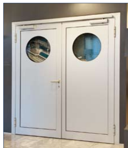
GEZE TS 5000 R-ISM